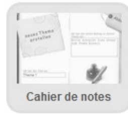
Cahier de notes